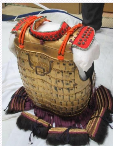
一來法師鎧の修理