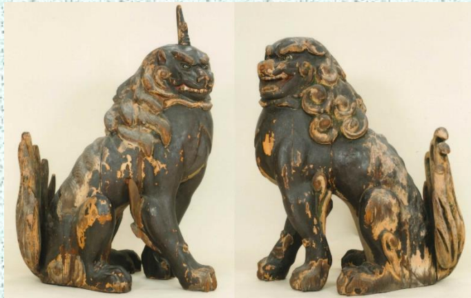
木造獅子(右)狛犬(左)

獅子・狛犬ともに檜材の寄木造りで彩色を施すが、両像ともに剥落が進行し、漆塗や彩色が下地から浮き上がっている状態でもあるため修理が行われた。